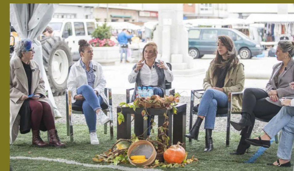
Mesa redonda polo Día Internacional da Muller Rural.