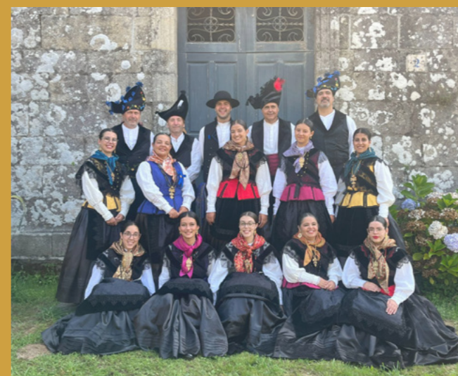
O grupo tradicional 'A Trubisquiña' percorreu todas as parroquias.

A Asociación A Trubisquiña foi a encargada de levar a alegría e a maxia do Nadal polas 14 parroquias de Vimianzo cos Cantos de Nadal. O pasado luns 16 de decembro comezaron en Carnés e, desde entón, percorren cada parroquia achegando a música local aos nosos veciños e veciñas. Unha proposta que, como cada ano, converteu estas festas nunha experiencia máis especial para toda a veciñanza.