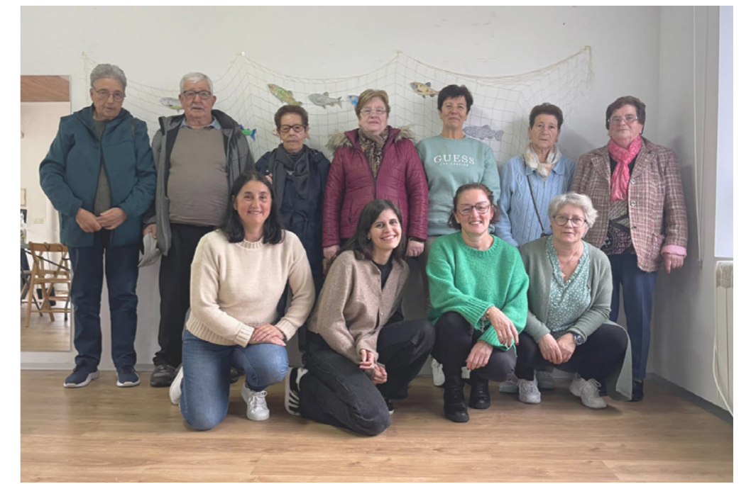
Obradoiro de interpretación do mar en Cereixo.