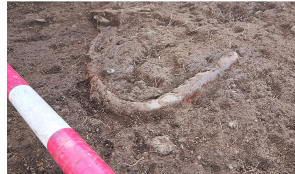
A antiga fouce descuberta na última escavación no Castro das Barreiras.