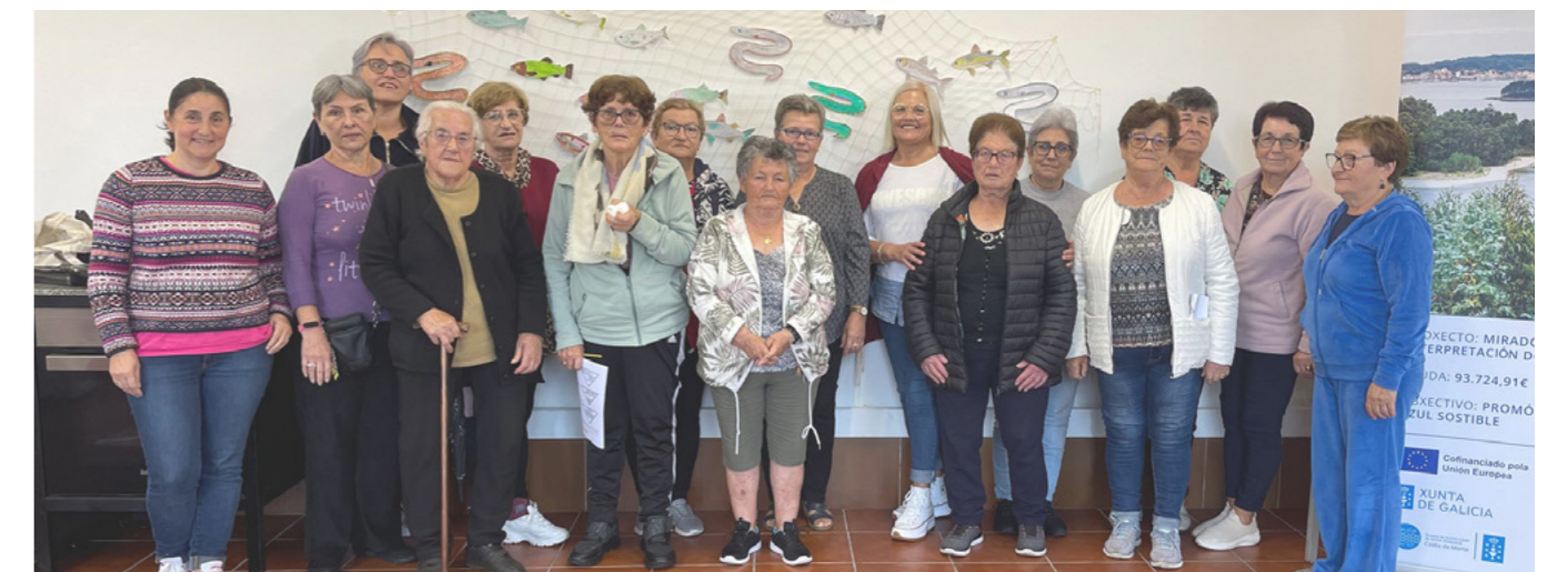
Obradoiro de interpretación do mar en Carnés.