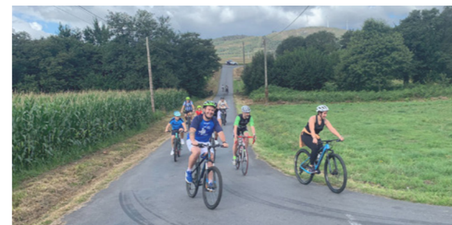
Participantes no Día da Bici polas rúas do municipio.