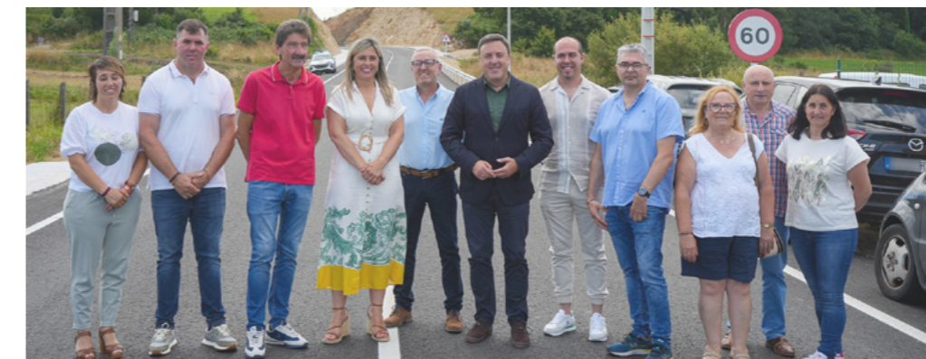
Imaxe da inauguración das obras.

Este ano díxémoslles adeus de maneira definitiva ás perigosas curvas da vía que une Caxadas con Baíñas. No mes de xullo inauguráronse as obras de ampliación, mellora do trazado e da seguridade peonil na estrada provincial DP-9203, que conecta estes lugares.