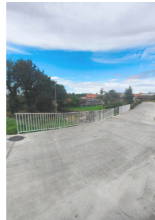
Rematadas as obras en Romar.

Os traballos incluíron tamén a execución de dous muros de granito rematados cunha varanda metálica.