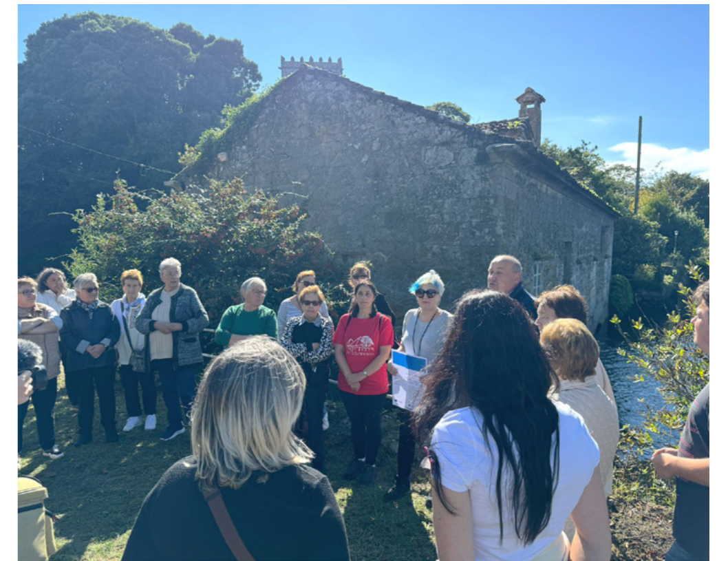
Ruta consciente e interpretada 'Camiñando cara ao mar en Cereixo'.

No proxecto non podía faltar un espazo para a gastronomía. Por iso, creouse un recetario no que se recompilan tanto receitas adaptadas coma outras tradicionais, homenaxeando as nosas raíces e a riqueza da terra.