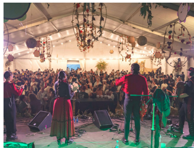
O Palco da Maquía acolleu a noite de concertos.

Durante estes dous días os muiños foron os grandes protagonistas dunha festa que contou con contos de taberna, panillada, contacontos para a rapazada, campionato de debullado de millo e moita, moita música. Dous escenarios e artistas como Unto Vello, Crua, Ailá e De Ninghures fixeron desta unha Muiñada que, definitivamente, quedou para a historia.