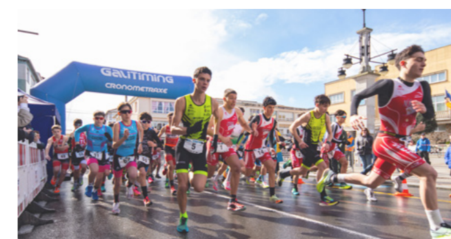
Liña de saída do Dúatlon de Reis.

O Dúatlon de Reis, a primeira gran proba deportiva do ano, xa ten experiencia na competición. Este ano terá lugar o 12 de xaneiro, unha cita sinalada