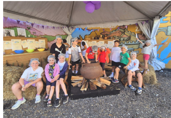
Pequenos científicos en busca da fórmula da igualdade.