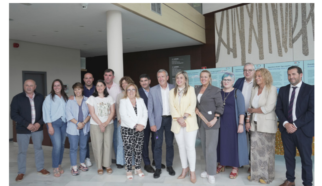
Foto de grupo no I Foro Atlántico Empresarial.

A alcaldesa mostrouse “moi agradecida porque SEA pensase en Vimianzo, terra de emprendedores, como o lugar no que inaugurar este foro”.