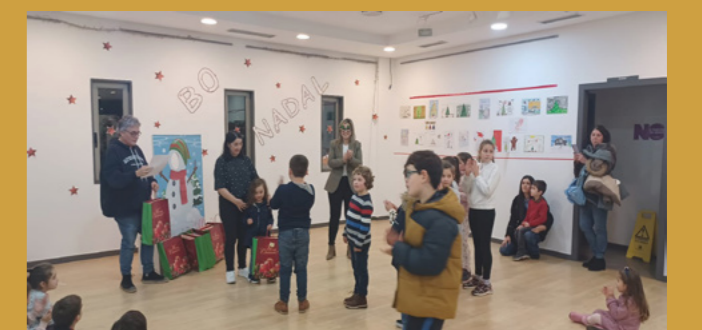
Imaxe da entrega de premios en 2023.

trando a tradicional árbore de praza do concello e os demais adornos, como as dúas árbores de luce da entrada ou o recuncho gastronómico.