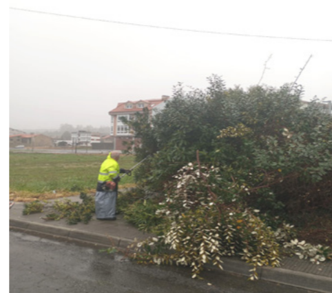
Traballos de poda.