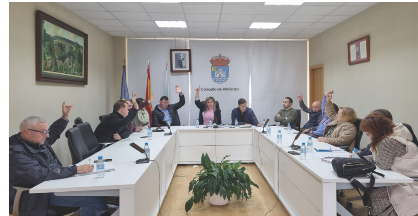
Imaxe da sesión ordinaria de novembro, na que saíron aprobados por maioría.

A alcaldesa subliñou que as contas se pecharon sen subir impostos e agradeceu o apoio da Deputación da Coruña. Tamén agradeceu o enorme traballo do equipo municipal para elaborar un documento equilibrado e transparente que reflicte as prioridades actuais: "o obxectivo é que Vimianzo siga crescendo".