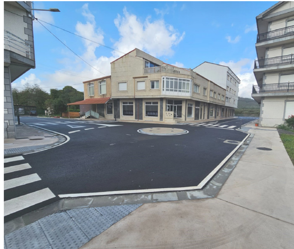
Creación dunha rotonda para mellorar a circulación na vía.

Reordenouse o tráfico e aumentouse a seguridade peonil