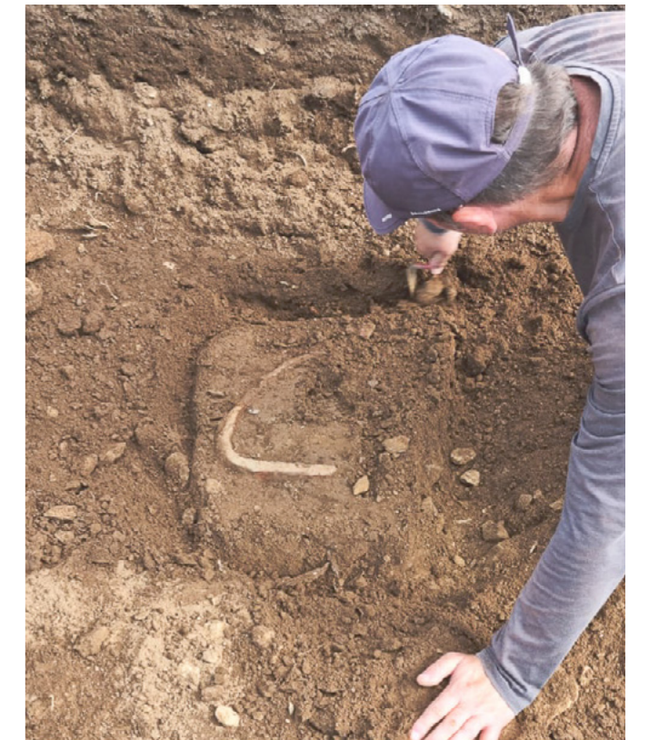
Arqueólogo traballando na zona na que se realizou o grande achado.

En xuño comezaba unha nova campaña de escavación no Castro das Barreiras. Non ían nin 10 días desde o inicio cando se fixo o descubrimento máis excepcional ata a data: unha fouce de 2.200 anos de antigüidade coa que se reafirman as teorías sobre a natureza agraria do asentamento.