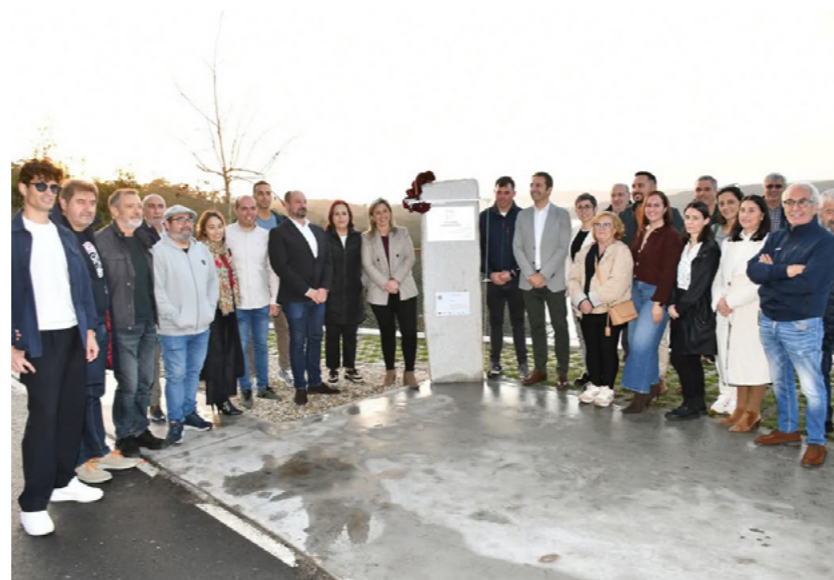
Inauguración da placa no miradoiro.