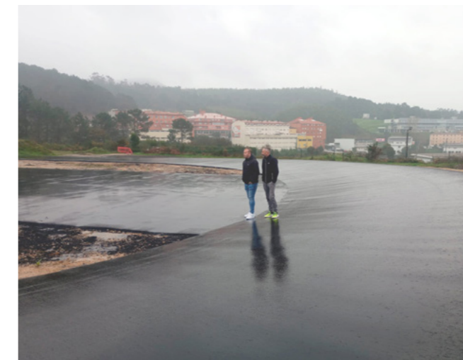
O concelleiro e o técnico municipal de Deportes supervisando as obras.

Con estas obras búscase fomentar a práctica deportiva e posicionar Vimianzo como un referente no ámbito do atletismo.