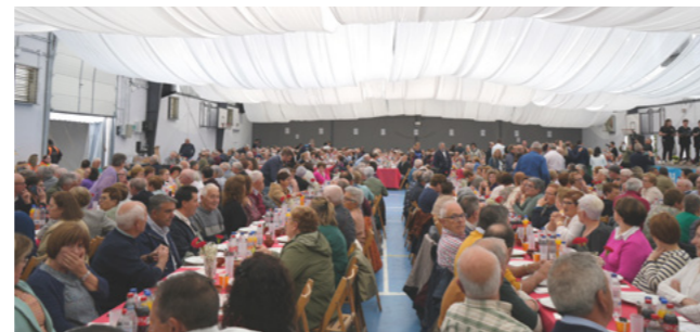
Un pavillón repleto para celebrar.

Máis de 1.100 persoas reuníronse á mesa para celebrar a 20.ª edición do Xantar de Maiores.