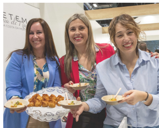
A alcaldesa e as concelleiras de Turismo e Benestar Social en Fitur.

Vimianzo presumiu en Fitur, o evento de referencia a nivel nacional no eido turístico, da riqueza gastro-