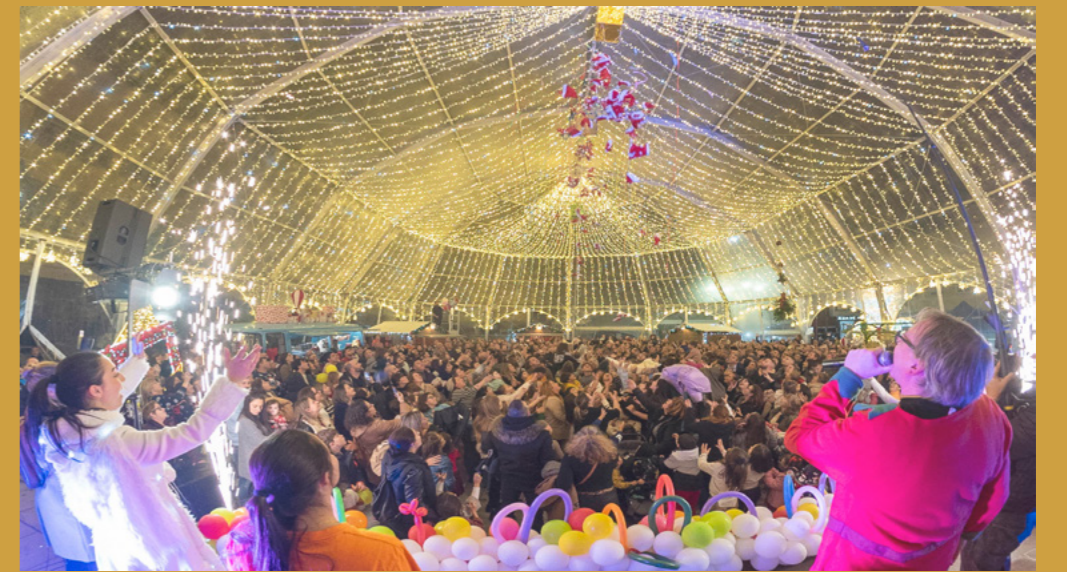
As luces acendéronse para marcar o comezo do Nadal.

As compras realizadas nos locais adheridos inclúen un ticket-bóla que os clientes poden trocar por vales no Bombo de Nadal, situado no Recuncho Gastronómico. Esta iniciativa trae centos de vales desconto e máis de 300 agasallos como: cestas de Nadal, un secador, unha bicicleta, unha fritidora de aire e mesmo unha televisión.