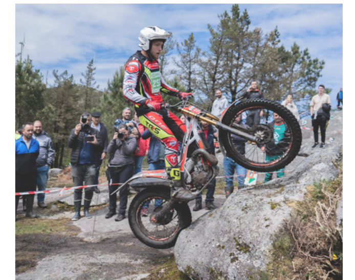
Un dos participantes subindo unha rocha no monte Faro.

que se enfrontaron nun circuito pechado repleto de rochas, barro e auga. Estes elementos puxeron a proba as habilidades dos deportistas en cada categoría, desde alevíns ata TR1, TR2, TR3, TR4, TR5 e CLB. Percorron o circuito en tres voltas.