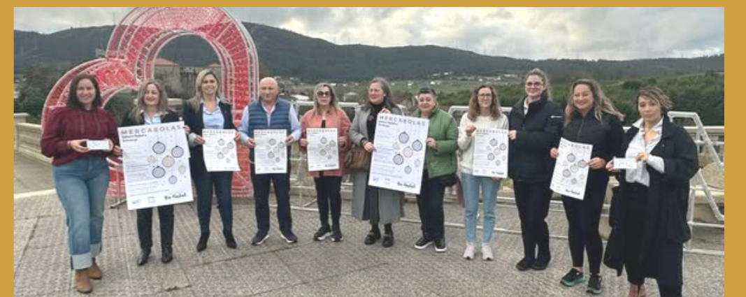
A hostalaría e o comercio únense na campaña Mercalume.