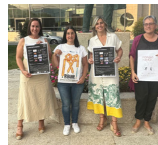
Programación cultural de outono.

proxección dos mellores filmes do audiovisual galego. Tamén foi a sede da VII edición do Ciclo Nacional de Cine e Mulleres Rurais.