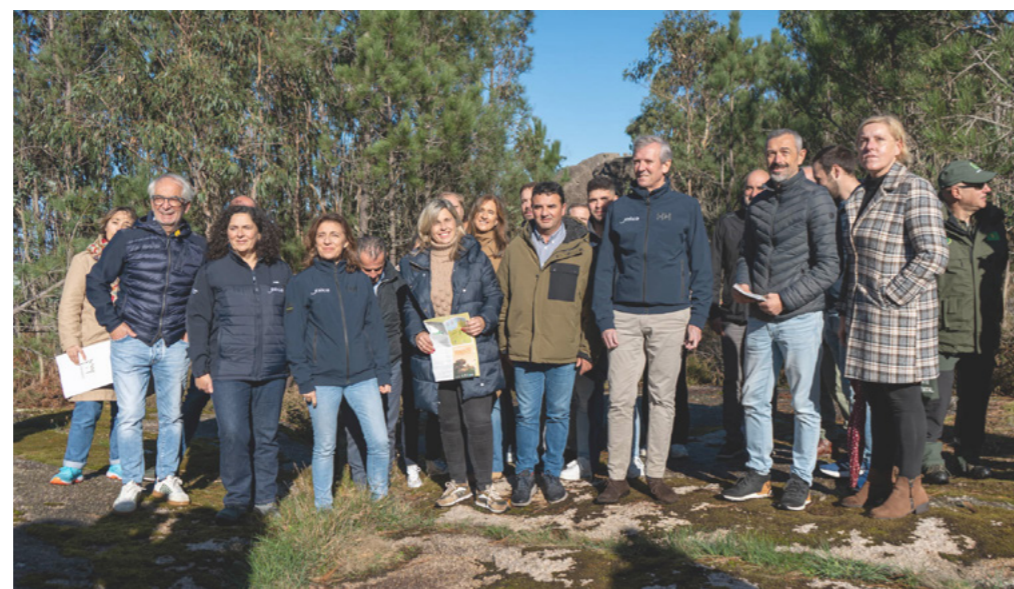
Presentación do Plan de Xestión cunha visita ao lugar.

ción dará aspecto de unidade ao conxunto e aumentará as zonas peonís para convivir coa circulación de vehículos. Incorporaranse tamén zonas verdes.