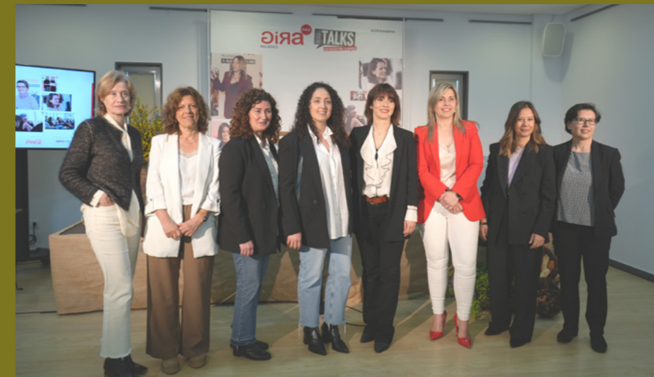
Vimianzo foi a primeira parada da Gira Mujeres Rural Talks.