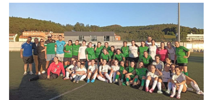
O equipo feminino da S.D. Soneira Club de Fútbol debutou esta tempada.

Exemplo foi a S.D. Soneira, que marcou un antes e un despois coa creación do seu equipo feminino.