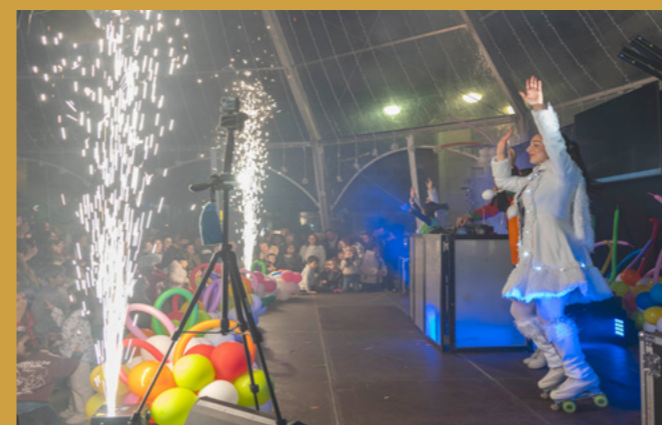
Vimianzo converteuse nunha gran festa para os máis pequenos.