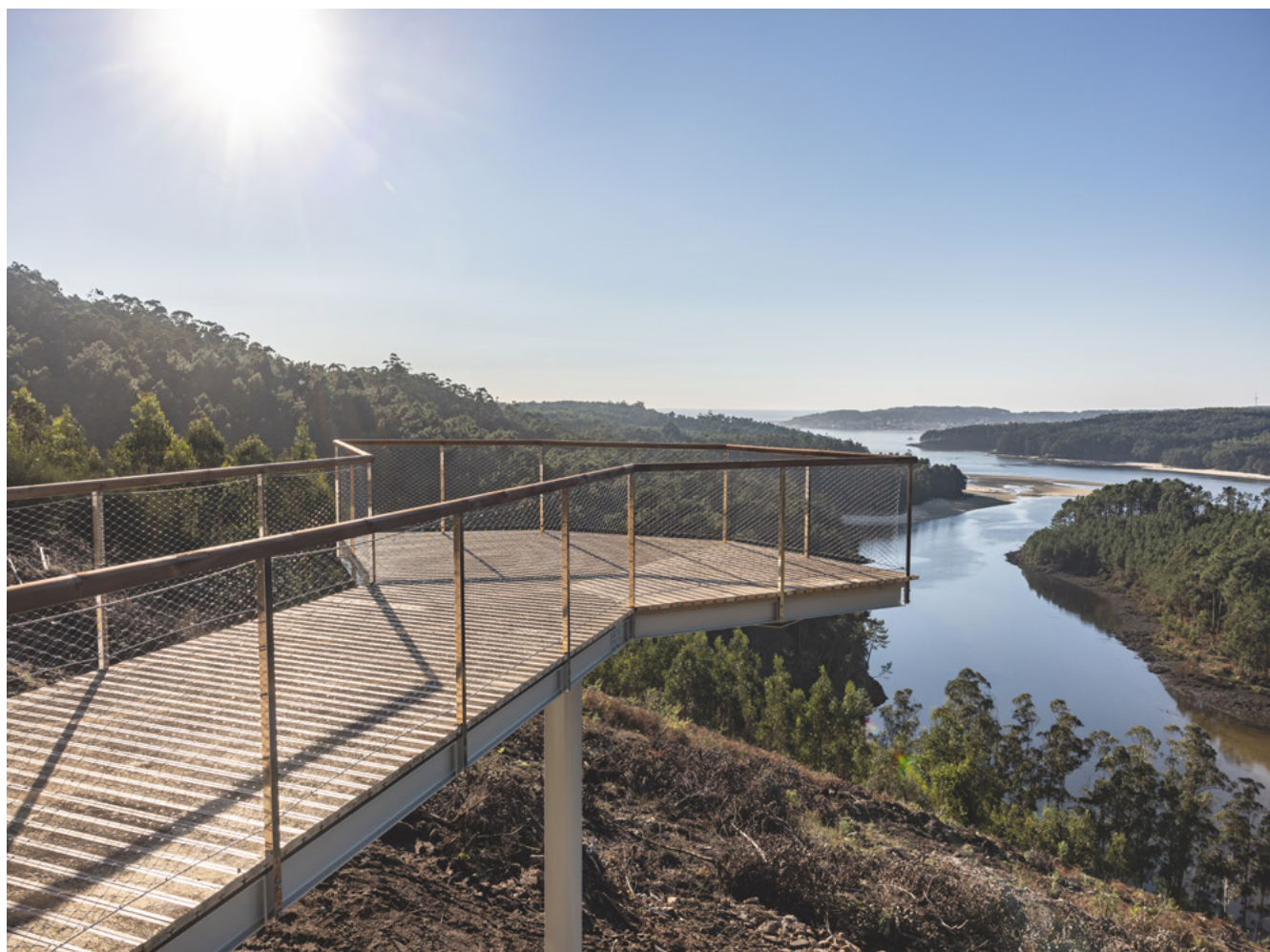
Resultado do miradoiro Furna do Sapo, en Cereixo.

O miradoiro Furna do Sapo, Cereixo, xa é unha realidade. As obras, financiadas con cargo a unha axuda da Consellería do Mar para estratexias de desenvolvemento