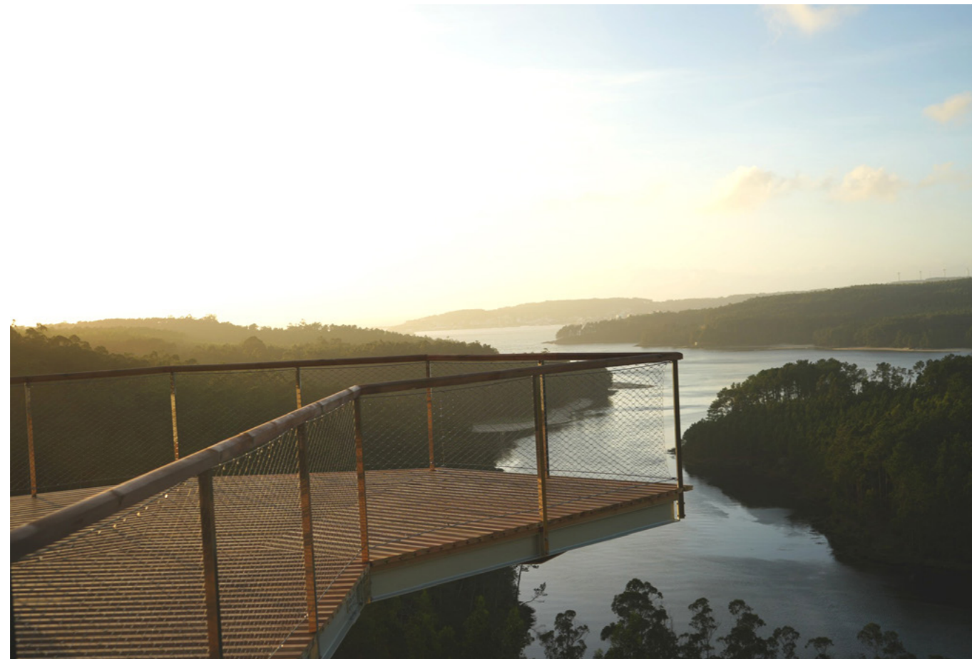
Vistas desde o miradoiro Furna do Sapo á ría de Camariñas.

Esta construción permite a posta en valor e a contemplación dun espazo de gran riqueza natural e paisaxística, así como o seu emprego recreativo e didáctico para toda a poboación. Desde el pódese contemplar a desembocadura do río Grande xunto a diferentes praias e calas, co océano Atlántico ao fondo.