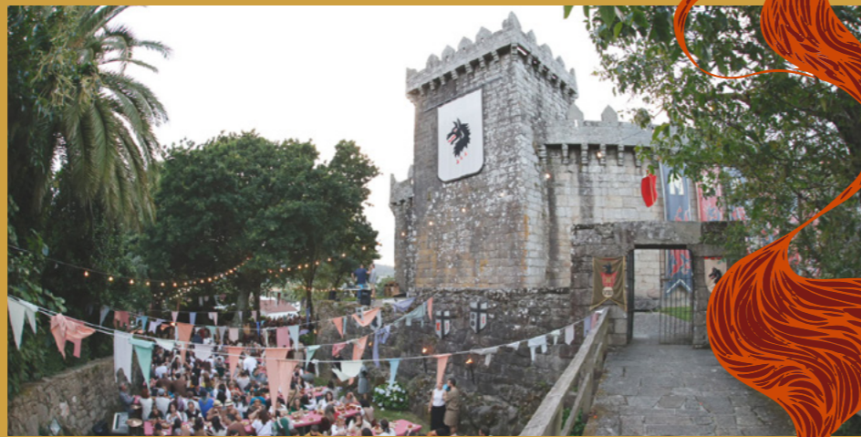
A cea medieval, unha das grandes citas da programación.

O traballo de moitos meses concéntrase nestes dous días que, cando rematan, só pensamos en que regresen. Grazas aos e ás participantes. Grazas, Axvalso e Cherinkas, por facelo posible. Que comece a conta atrás.