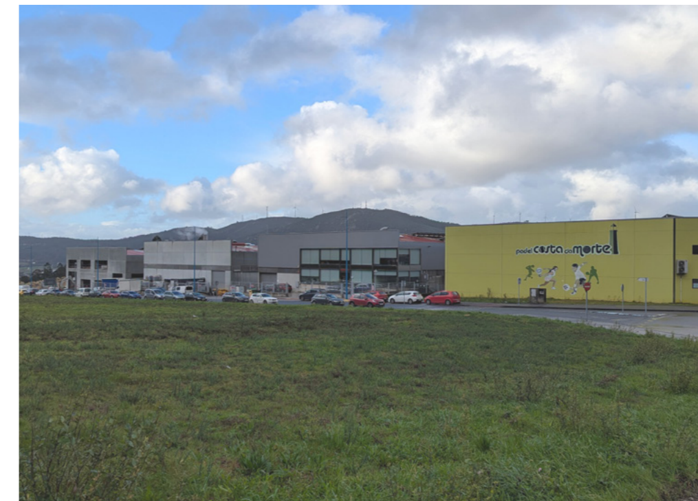
O parque empresarial mantén o seu crecemento.

O Concello e SEA continúan traballando de maneira conxunta para para seguir promovendo o crecemento do parque empresarial. Ao longo do ano, mantiveron diversas reunións co obxectivo de formular propostas varias, como o dereito a superficie ou alugueiro con opción a compra.