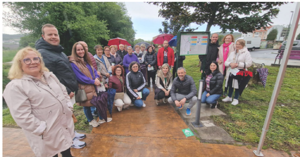
Presentación do Roteiro Saudable.

Durante a ruta faise fincapé nos múltiples beneficios de camiñar, como: prevención de enfermidades, benestar físico, redución da obesidade ou mellora do estado de ánimo. Ademais, tamén se recollen algunhas recomendacións da OMS.