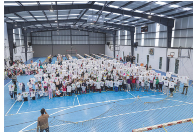
Vimianzo tende a igualdade polo 25N.