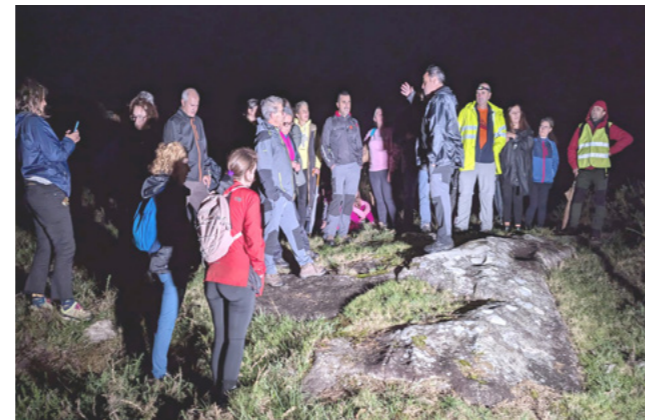
A Noite de Petros, en Berdoias.

Unha nova edición da 'Noite de Petros' permitiunos descubrir a fascinante historia dos petróglifos de Berdoias e Boallo, admirando estas antigas manifestacións rupestres e gozando dunha noite máxica repleta de aprendizaxes.