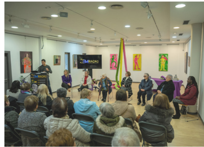
Presentación do podcast 8 Miradas.

Con esta mesma meta, no marco da celebración do Asalto ao Castelo, a rapaza realizou diversos experimentos que lle permitiron atopar os ingredientes para a fórmula da igualdade. Unha vez os descubriron, na xornada do 25N aprenderon a distinguir o maltrato, pintando as súas camisetas para reivindicar a necesidade de acabar coa violencia machista.