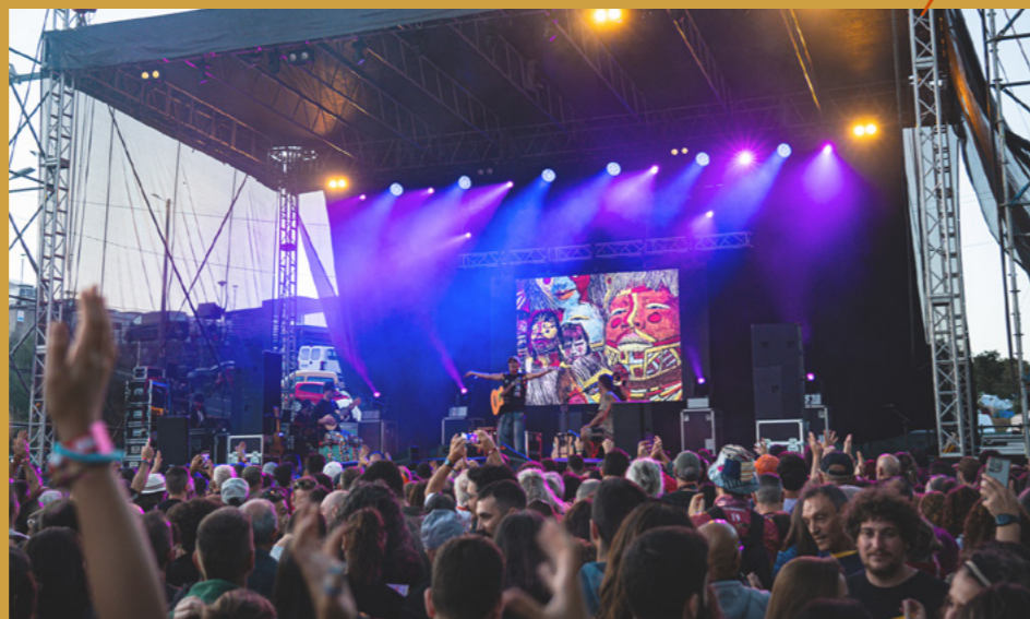
O público vibrou co concerto de Manu Chao en acústico.