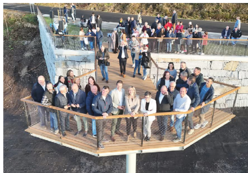
Vista aérea do novo miradoiro.

ca, "de noite deixa ver un ceo estrelado sen igual, en todo o seu esplendor, creando unha experiencia Starlight preciosa xa que o lugar carece de contaminación lumínica".