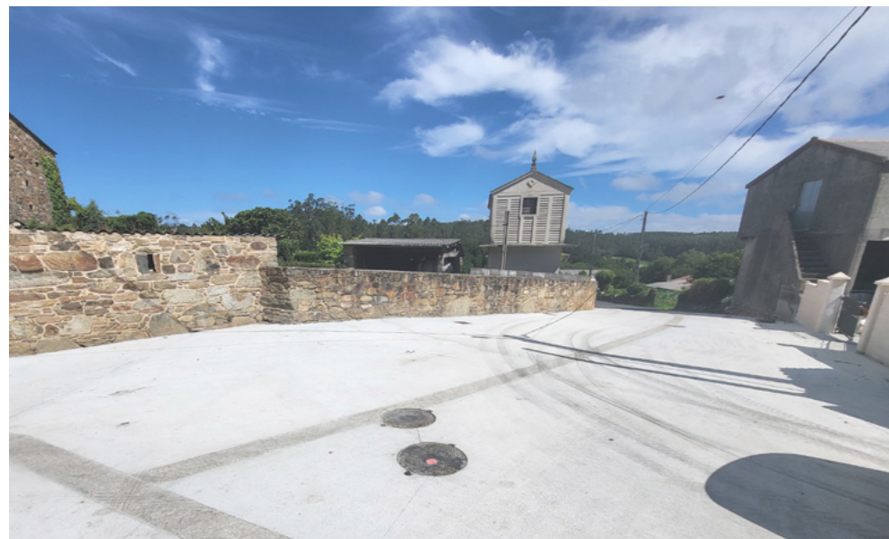
Resultado dos traballos de pavimentación no núcleo de Colúns.