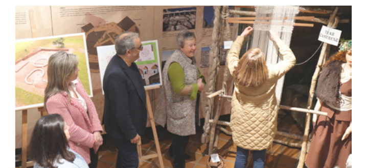
Inauguración da exposición 'Do castrexo ao medieval'.