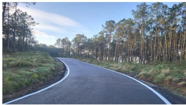
Finalizadas as obras de pavimentación en Moreira (Carnés).