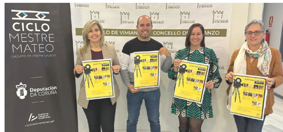
Vimianzo acolleu por primeira vez o ciclo Mestre Mateo.