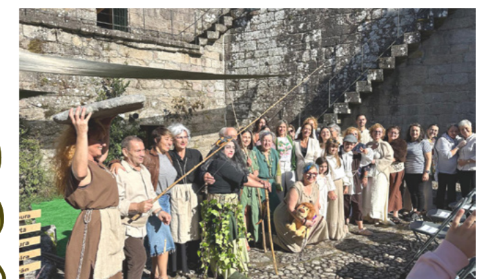
Clausura das visitas teatralizadas ao Castelo dos Quinquilláns.